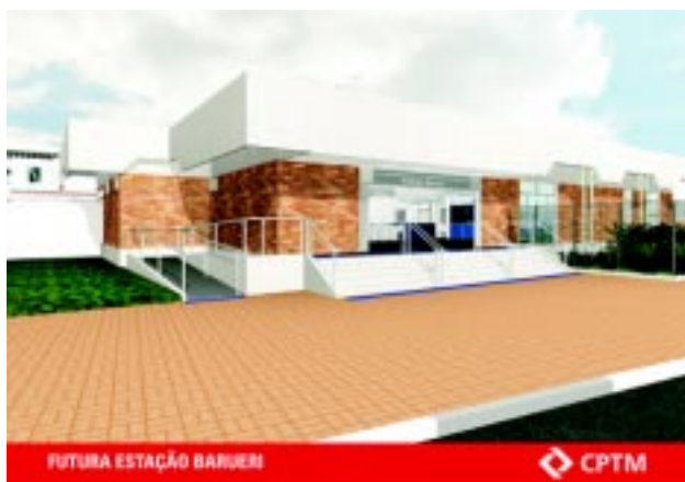
FUTURA ESTAÇÃO BARUERI