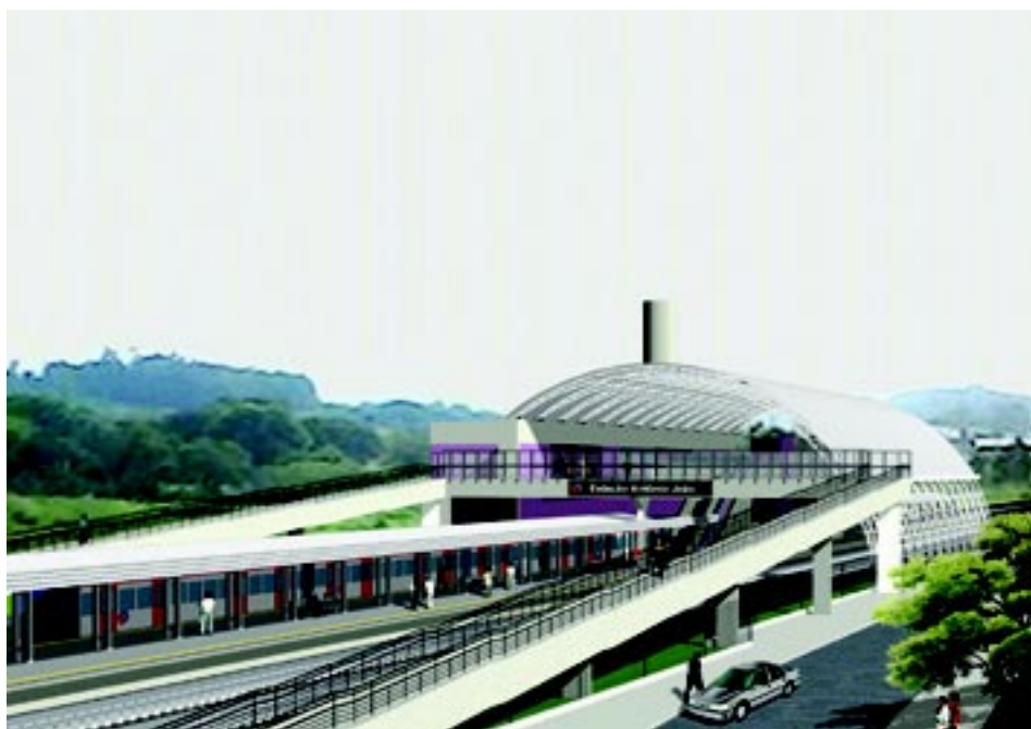
Simulação digital da nova estação de trem Antonio João