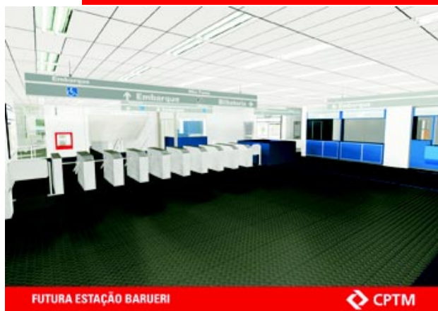
FUTURA ESTAÇÃO BARUERI